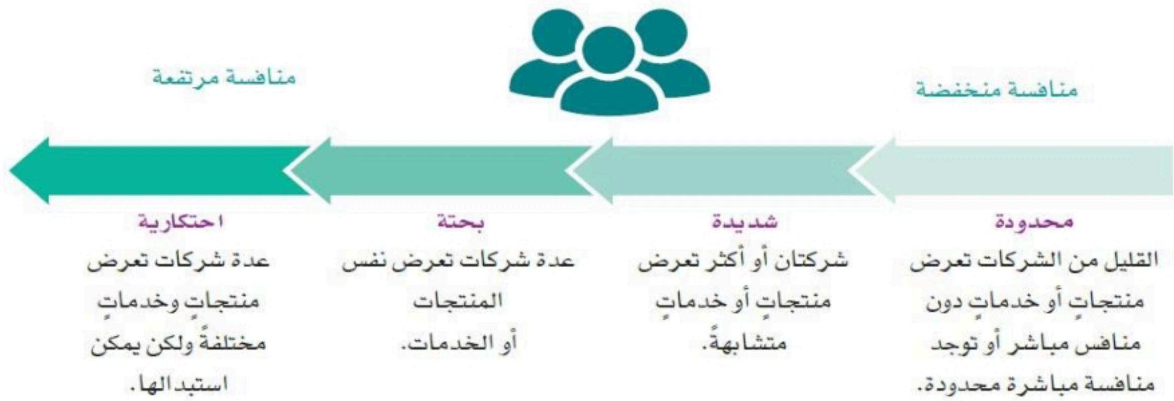
الشكل "4-2" درجات المنافسة