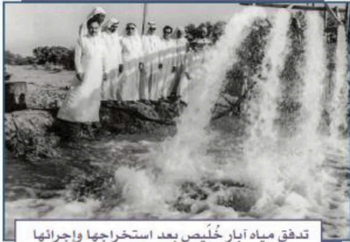
تدفق مياه آبار خُلَيْص بعد استخراجها وإجرائها في أنابيب العين العزيزية