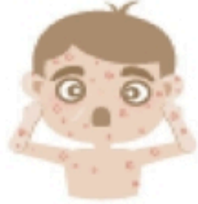
جُدْرِيّ الماء (المنقز)