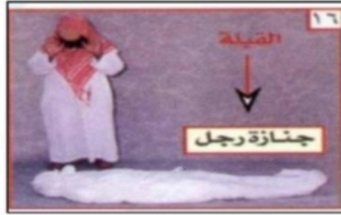
٣- الصلاة عليه