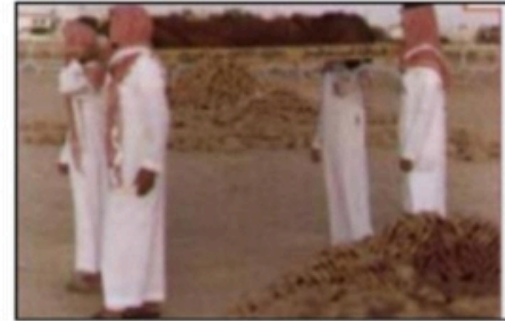
٤- اتباع جنازته

حكمها: فرض كفاية ( إذا قام بها البعض سقط الإثم عن الباقيين )